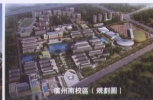
廣州南校區（規劃圖）