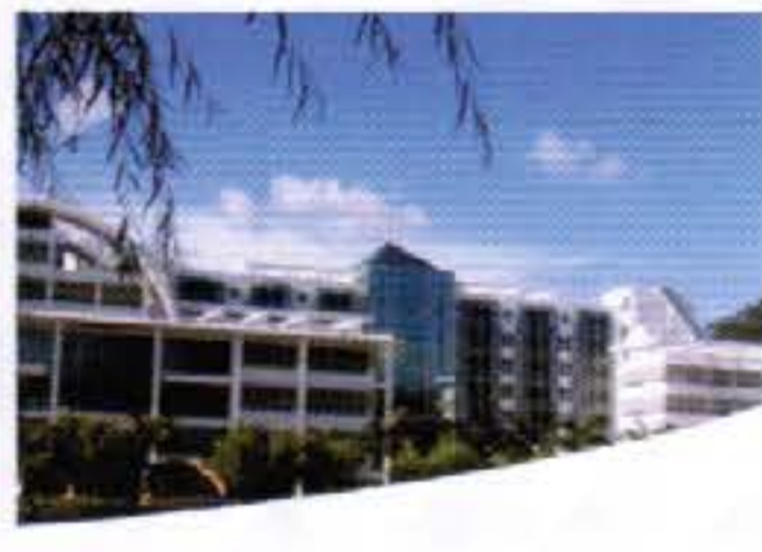
暨南大學【珠海校區】