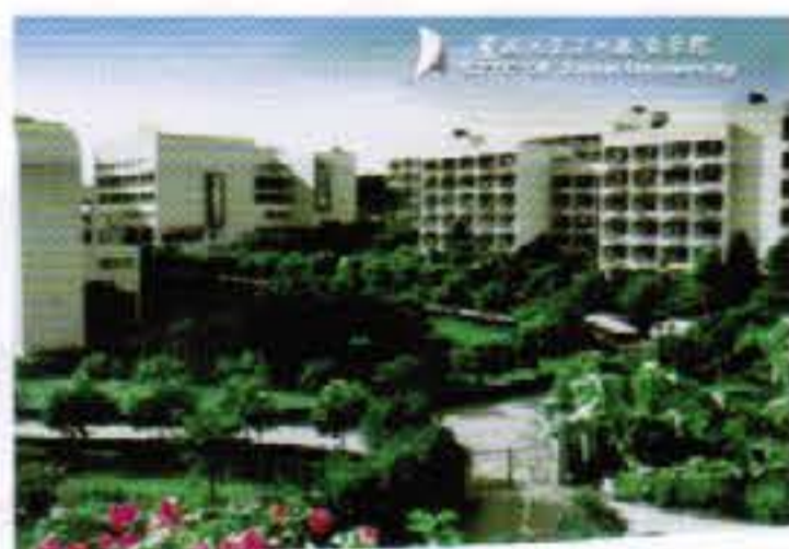
暨南大學【深圳旅游學院】