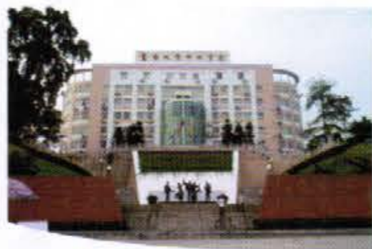
暨南大學【華文學院】

學校在廣州、深圳、珠海三地設有四個校區，並正在廣州籌建新校區。學校設有16所附屬醫院。截至2013年4月，有各類學生443697人，在校研究生10354人（其中，博士研究生1164人、碩士研究生7851人，在職攻讀碩士學位研究生1339人），在校全日制本科生18737人。在校的華僑、港澳臺和外國學生11124人。學校學風濃郁，人文薈萃，環境優雅，設施齊備，生活、交通便利，已成為臺灣學生赴大陸升學的熱門高校。